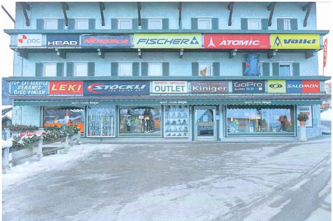
Werbekulisse statt Naturkulisse: «Zwei, drei Hansel haben uns wieder und wieder blockiert.» (Sexten, Dezember 2013)