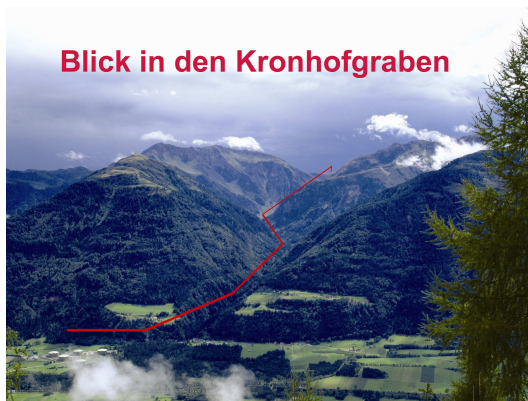
Bild: Unversehrte, naturnahe Landschaft