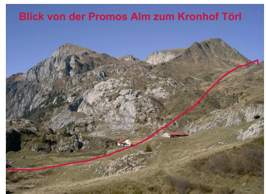
Bild: Natura 2000 Gebiet und Vogelschutzgebiet